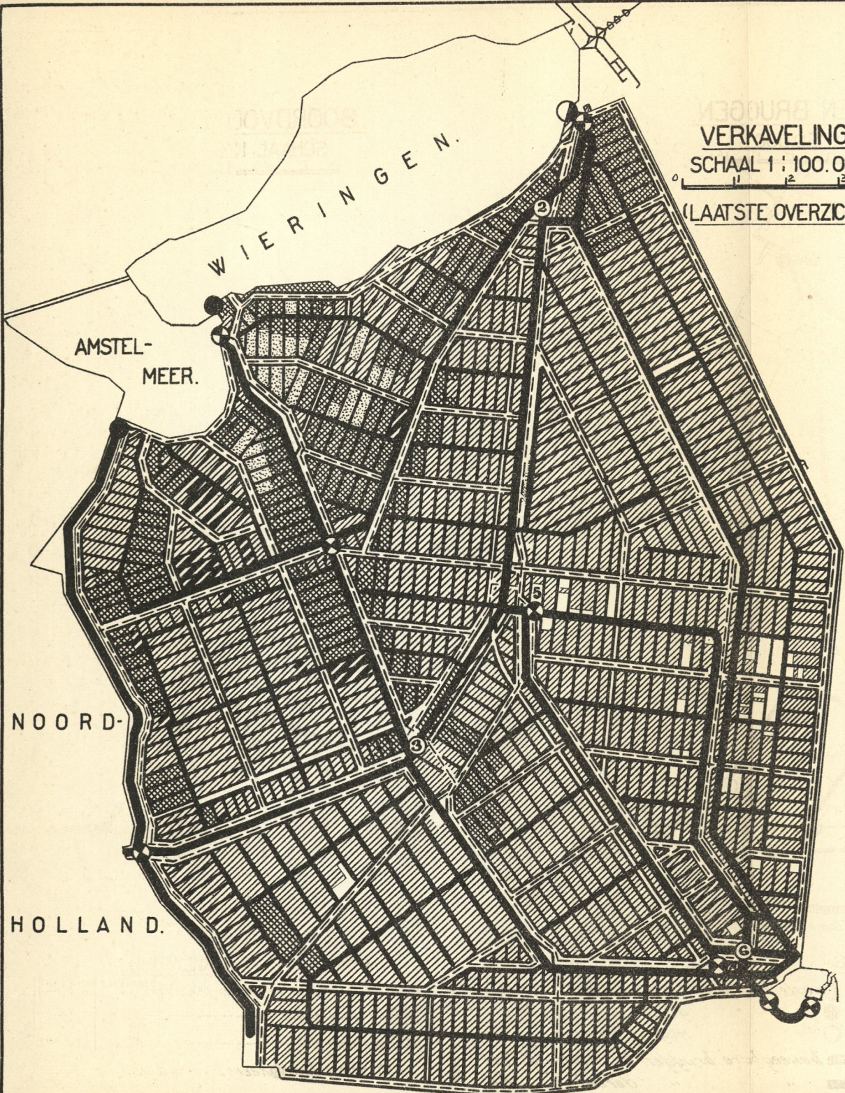
VERKAVELING. SCHAAL 1:100.000. (LAATSTE OVERZICHT.)