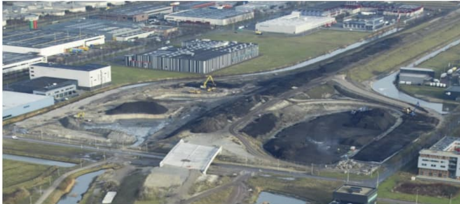
Figuur 4.6 Werkzaamheden aanleg Westrandweg km 13.5, 10 januari 2011

Op basis van de toepassing van TGG direct op het oorspronkelijke maaiveld is het mogelijk dat TGG raakt met het grondwater. Er wordt aangenomen dat er geen absolute drooglegging is. De oorspronkelijke bodem bestaat grotendeels uit veen waardoor er voldoende afdichting is aan de onderzijde. Aan de bovenzijde is er deels afdichting door asfalt, maar aangenomen wordt dat de afdichting bij het talud onvoldoende is om infiltratie tegen te houden.