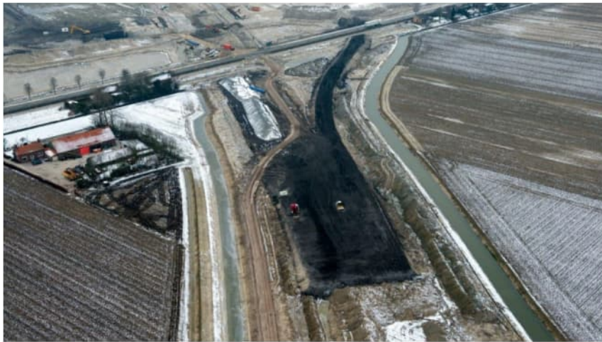
Figuur 4.5 Foto locatie 10: Aanleg A4 12 februari 2013

Tevens is aangenomen er geen isolatiemaatregelen zijn getroffen, anders dan het aanbrengen van asfaltering.