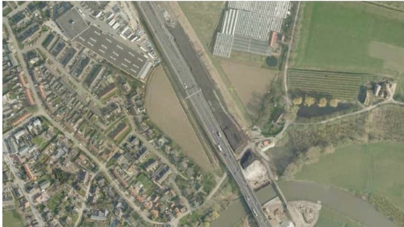
Figuur 4.2 Luchtfoto 2008 (bron: Globespotter), A2 aanleg brug over de Linge