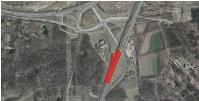
Figuur 4.7 Luchtfoto 2017 (bron: Globespotter), Knooppunt Paalgraven. In rood de toepassing van TGG.

Gezien de ligging van de onderzijde van de bouwstof op circa 15,0 m +NAP en de GHG van 14,1 m +NAP, is volgens het monitoringsrapport voldaan aan de droogleggingseis.