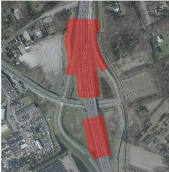
Figuur 4.3 Luchtfoto 2017, locatie 9.1: A4, aansluiting op de Randweg Oost / N286 in Bergen op Zoom. In rood de toepassing van TGG.