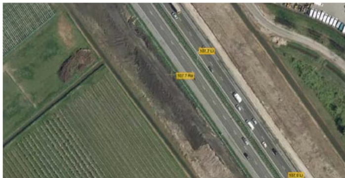
Figuur 4.1 Luchtfoto 2009, verbreding A2, km 107.7