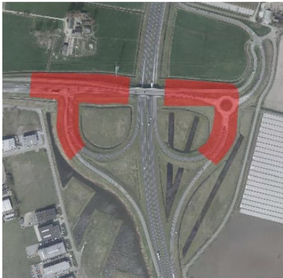
Figuur 4.4 Luchtfoto 2017, locatie 9.2: A4, aansluiting op de Randweg Oost / N286 in Halsteren. In rood de mogelijke toepassing van TGG.

De omgeving is niet gevoelig, omdat er theoretisch geen veedrenking is en voornamelijk bos.