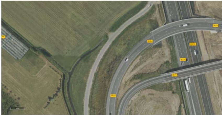
Figuur 6.1 Luchtfoto 2019

In bijlage 5 zijn foto's opgenomen die zijn gemaakt tijdens de veldinspectie.