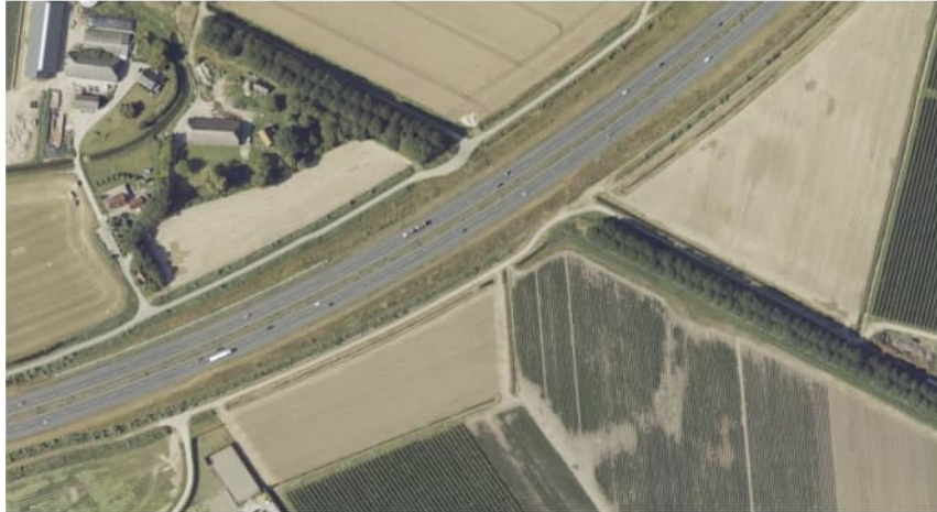
Figuur 2.5 Luchtfoto 2019, Triangel, Steenberg t.h.v. km 218.4.