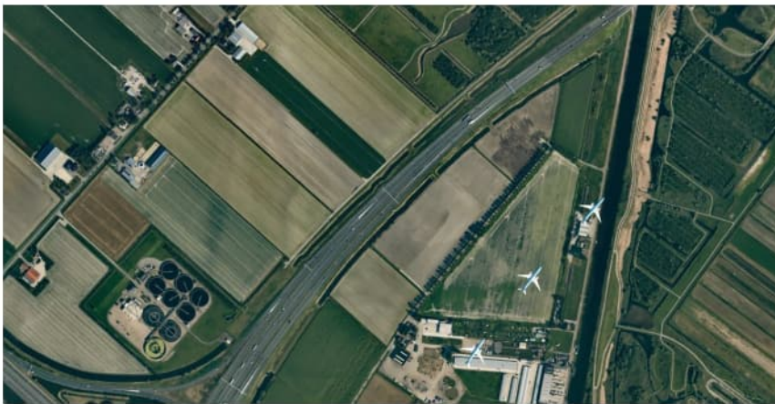
Figuur 3.1 Luchtfoto 2019, Vak B, Westrandweg t.h.v. km 218.4.