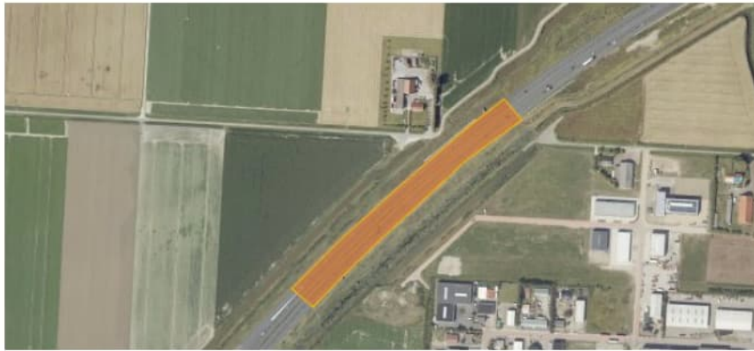
Figuur 2.4 Luchtfoto 2019, West-Groeneweg, Steenbergen t.h.v. km 222.8. In oranje de IBC-toepassing van AEC-bodemas.

Tegen het talud is over circa 20 meter een betonnen keerwand aangebracht om afschuiven te voorkomen (zie foto 4.2). Tijdens de inspectie zijn geen grote deformaties in het wegtalud gezien. Ter hoogte van het bezochte punt is de bermsloot over te steken om het schouwpad te betreden. Het schouwpad was ten tijde van het bezoek niet dicht begroeid en goed begaanbaar. Het deel waar mogelijk TGG is toegepast is echter makkelijker te bereiken via Zeelandweg-Oost.