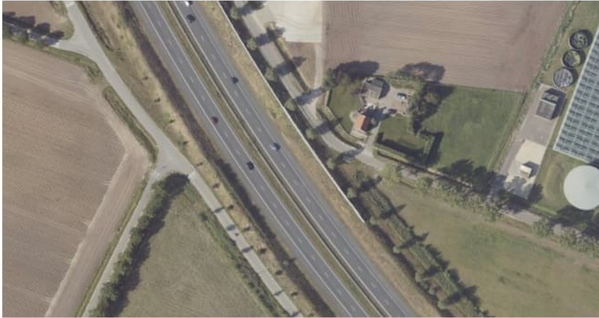
Figuur 2.2 Luchtfoto 2019, Hoek Stierenweg/Zoekweg, Steenbergen t.h.v. km 226.8.

Met opmerkingen [ 3]: Belangrijkste benamingen in de foto vermelden.