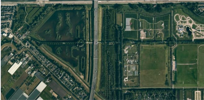
Figuur 3.3 Luchtfoto 2019, Vak D, Westrandweg t.h.v. km 11.4 tot km 12.0.