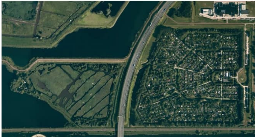
Figuur 3.4 Luchtfoto 2019, Vak E, Westrandweg t.h.v. km 12.1 tot km 12.4.