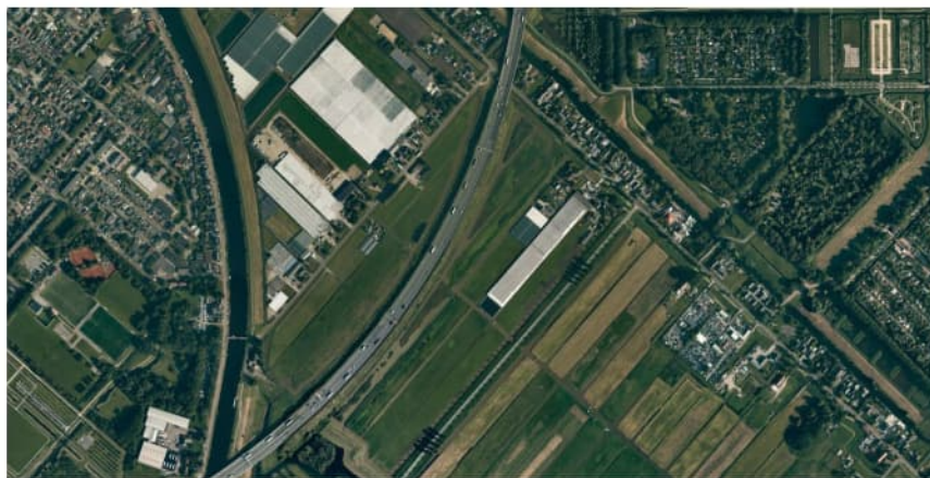
Figuur 3.2 Luchtfoto 2019, Vak C, Westrandweg t.h.v. km 10.1 tot km 11.3.