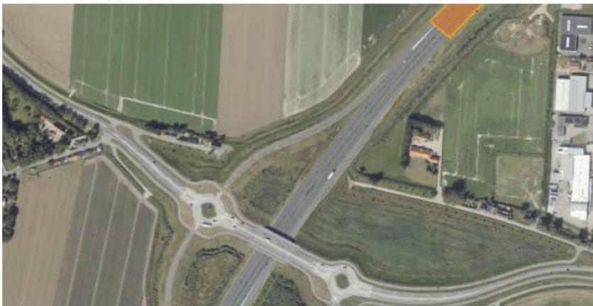
Figuur 2.3 Luchtfoto 2019, Zeelandweg-Oost, Steenbergen t.h.v. km 223.4. In oranje de IBC-toepassing van AEC-bodemas.

Tussen km 223.1 en km 223.4 is, op basis van foto's die zijn genomen tijdens de aanleg, mogelijk TGG toegepast als ophoogmateriaal zowel ter plaatse van de A4 als de afrit. De locatie is bezocht aan de zuidzijde van de A4. Tijdens de inspectie zijn geen grote deformaties in het wegtalud gezien. Het schouwpad was kort gemaaid en goed begaanbaar. Langs het schouwpad is een watergang aanwezig (zie foto 3.1). Het water vertoonde geen afwijkende kleur. Zeelandweg-Oost is aan beide zijden van de A4 een doodlopende straat waar makkelijk geparkeerd kan worden.