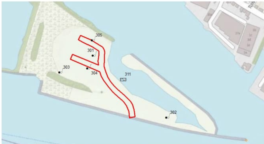
Figuur 4.1 Monsternameplan monitoringsnetwerk Kleine zaag, Krimpen a/d Lek

De peilbuizen dienen boven maaiveld te worden afgewerkt, te worden voorzien van een waterdichte dop en een schutkoker ter bescherming. Middels coördinaten dient de situering van de peilbuizen te worden vastgesteld. Voor de grondwatermonstername kan gebruik worden gemaakt van 06-GPS om de peilbuizen terug te vinden.