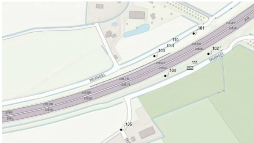
Figuur 2.1 Monsternameplan Triangel, monitoringsnetwerk A4 Omlegging Steenbergse

De peilbuizen dienen te worden afgewerkt met een ijzeren straatpot onder maaiveld. Middels coördinaten dient de situering van de peilbuizen te worden vastgesteld. Voor de grondwatermonstername kan gebruik worden gemaakt van 06-GPS en een metaaldetector om de peilbuizen terug te vinden.