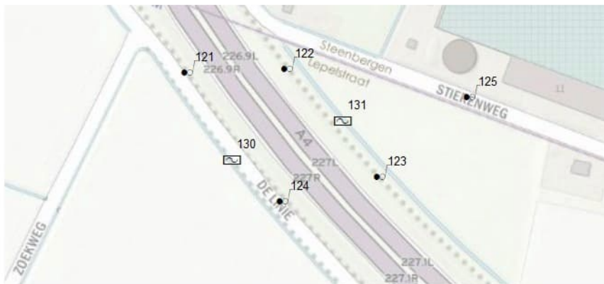
Figuur 2.2 Monsternamenplan Zoekweg, monitoringsnetwerk A4 Omlegging Steenberg

De peilbuizen dienen te worden afgewerkt met een ijzeren straatpot onder maaiveld. Middels coördinaten dient de situering van de peilbuizen te worden vastgesteld. Voor de grondwatermonsternamen kan gebruik worden gemaakt van 06-GPS en een metaaldetector om de peilbuizen terug te vinden.