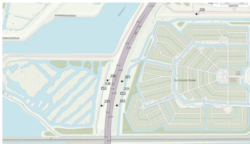
Figuur 3.2 Monsternameplan Vak E monitoringsnetwerk A5 Westrandweg Amsterdam

Naast het onderzoek naar de kwaliteit van het grond- en oppervlaktewater dient een visuele inspectie te worden uitgevoerd. Waarbij wordt gelet op scheurvorming van het wegdek, afschuiving van het talud en kleurvorming (oplossen zouten) van de bodem maar ook bijzonderheden in het oppervlaktewater.