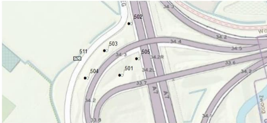
Figuur 6.1 Monsternameplan monitoringsnetwerk afrit 9 A7 nabij Hoom

Naast het onderzoek naar de kwaliteit van het grond- en oppervlaktewater dient een visuele inspectie te worden uitgevoerd. Waarbij wordt gelet op scheurvorming van het wegdek, afschuiving van het talud en kleurvorming (oplossen zouten) van de bodem maar ook bijzonderheden in het oppervlaktewater.