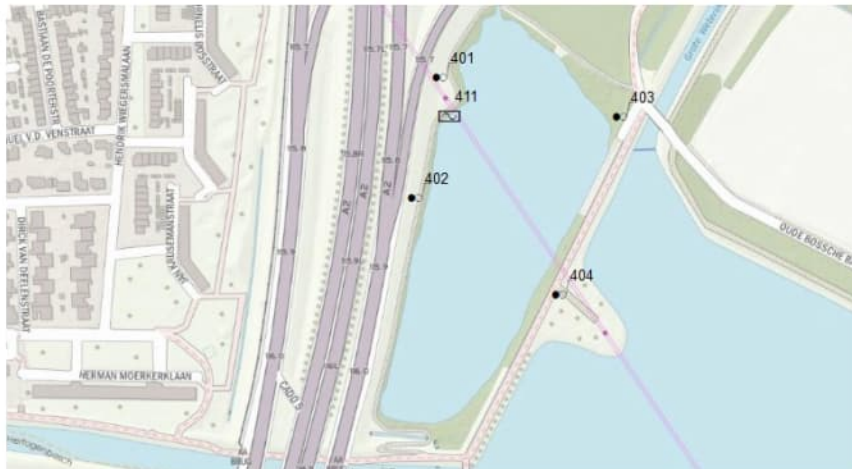
Figuur 5.1 Monsternameplan monitoringsnetwerk A2 Rondweg Den Bosch

Naast het onderzoek naar de kwaliteit van het grond- en oppervlaktewater dient een visuele inspectie te worden uitgevoerd. Waarbij wordt gelet op scheurvorming van het wegdek, afschuiving van het talud en kleurvorming (oplossen zouten) van de bodem maar ook bijzonderheden in het oppervlaktewater.