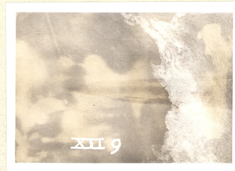
Foto's 1 en 2. Drijvermeting 12 april 1956. Losse drijvers kort na elkaar ingezet bij de bovenstroomse pijler op de rechteroever.