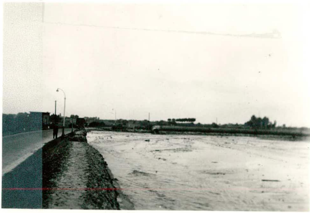
Vulling loswal I; tekst pag. 125.