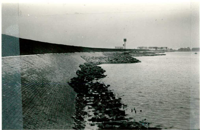
Glooiing van klinkerkeien tegen het beloop van loswal III.; tekst pag. 69.