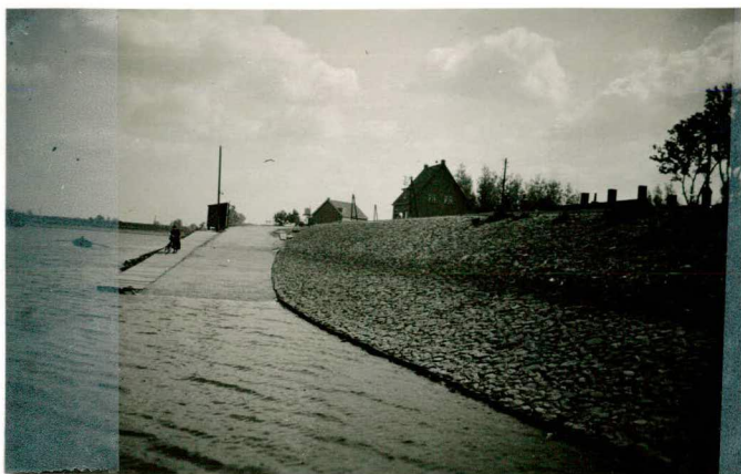
Veerstoep "Spreeuwenhoek"; tekst pag. 73.