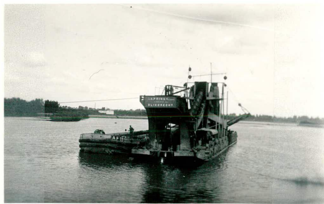
Baggermolen in rivier.