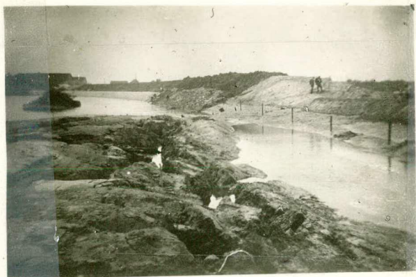
Verzakking van den nieuwen dijk langs loswal III.; tekst pag. 67.