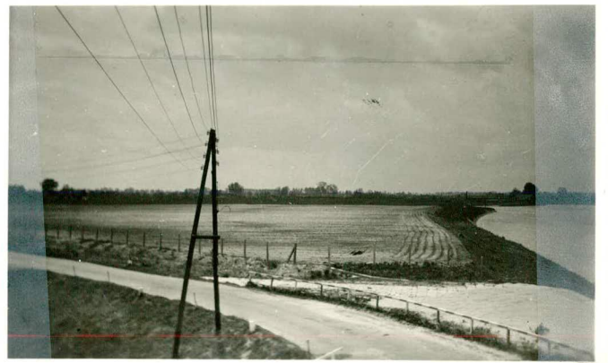
Overzicht loswal I.