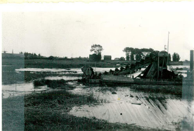
Baggermolen in zelling.