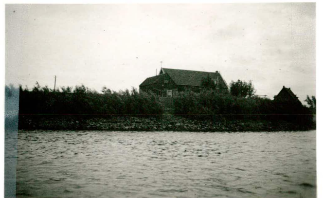
Begroeiing met wilgenstruiken bo- ven H.W. van het beloop van los- wal IIA; tekst pag. 86.