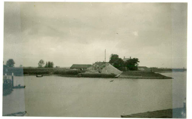
Overzicht loswal II.