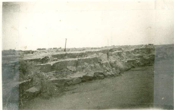
Verzakking van den nieuwen dijk langs loswal III.; tekst pag. 67.