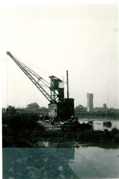
Kraan in zelling.