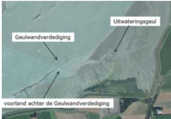
Figuur - Satellietopname geulwandverdediging Gat van Ossensisse II (augustus 2019)