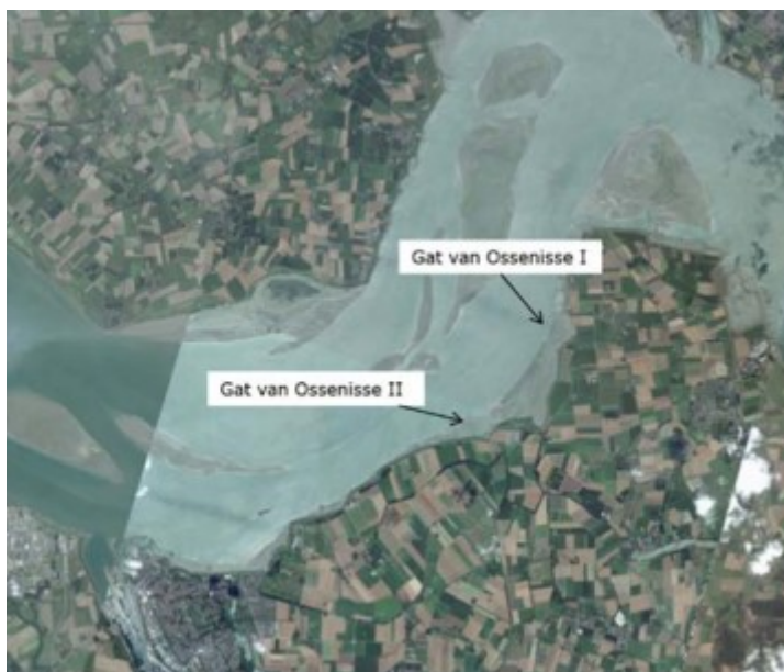
Situatieschets geulwanden Gat van Ossensisse I en Gat van Ossensisse II

De geulwandverdediging ligt ter hoogte van Ossensisse langs de zuidoever van de Westerschelde.