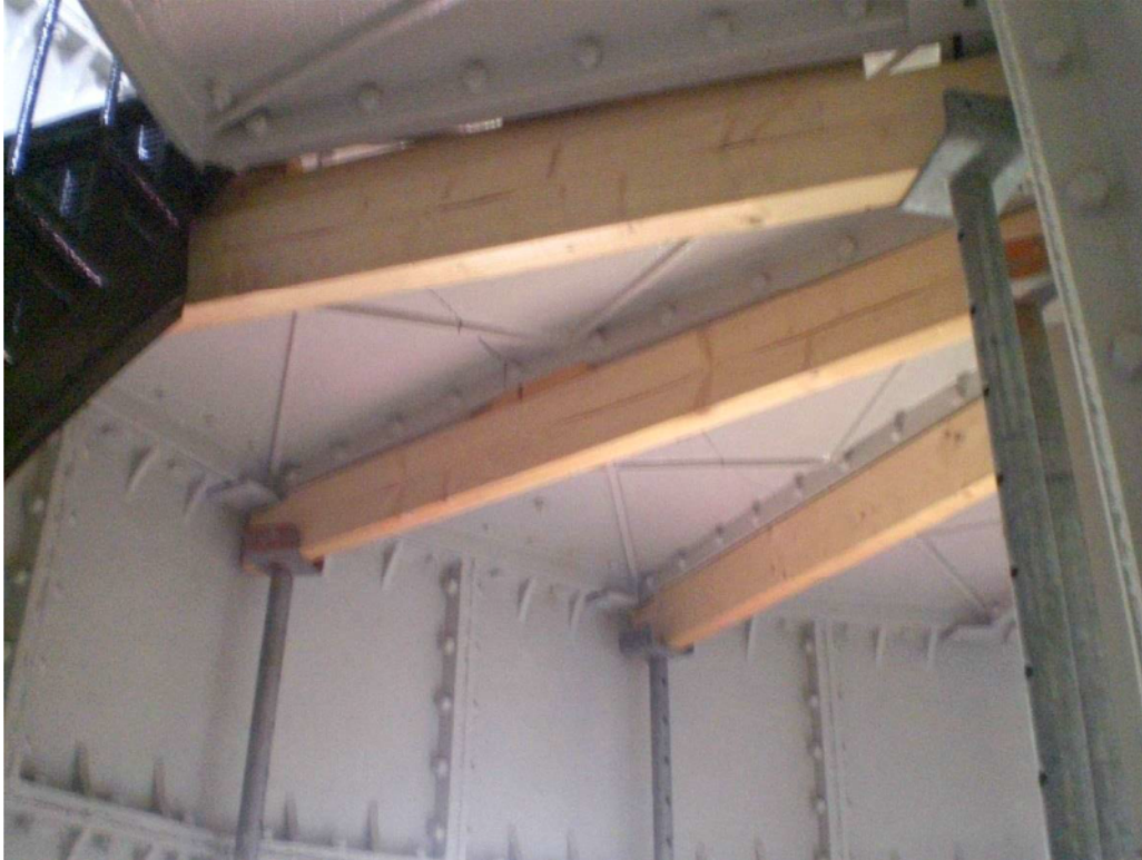
foto 1 onderslag balken ter plaatse van de ribben