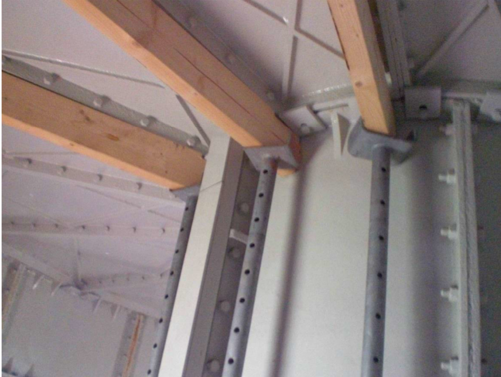
foto 3 Onderslag balken ter plaatse van de binnen schacht