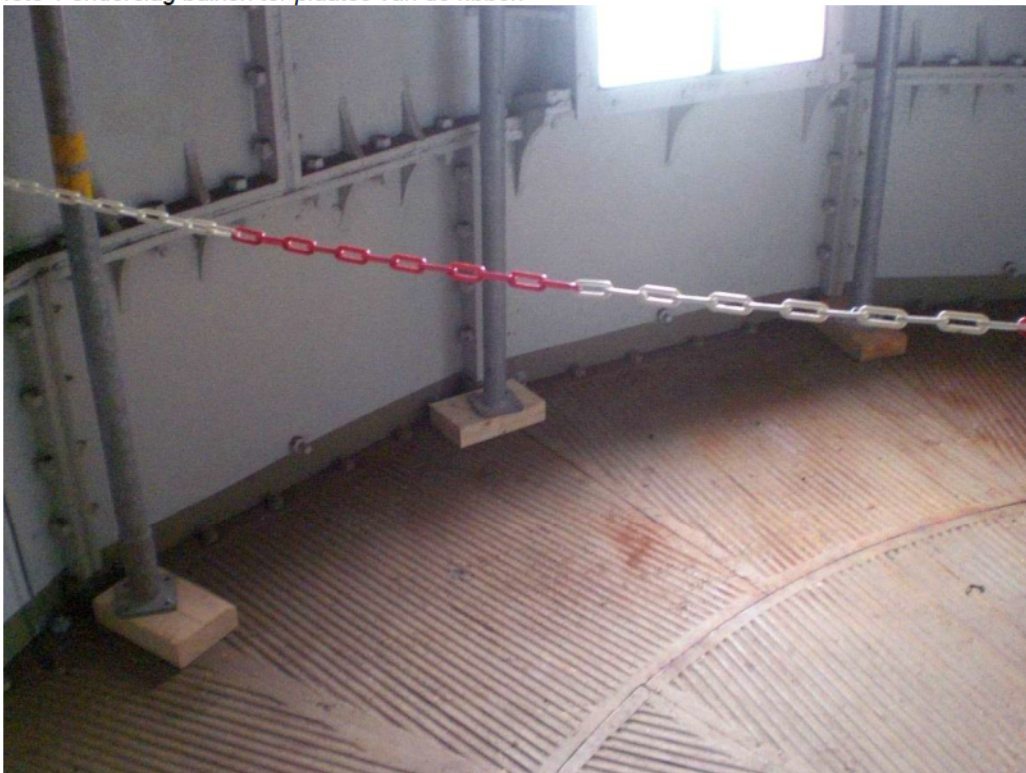
foto 2 Houten onderslagen ter plaatse van de stempels aan de buitenzijde